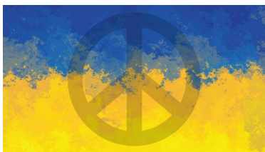
logo dessiné par Caritas Canada, février 2022

Le numéro 8 publié en mars 2022 consacré à la diversité des apprentissages et dédié à l'Ukraine