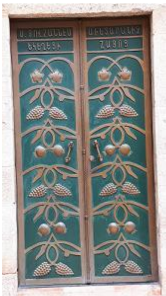
Porte à Jérusalem (Israël), janvier 2020

Le numéro 6 publié en mars 2021 consacré à la diversité culturelle et interculturelle.