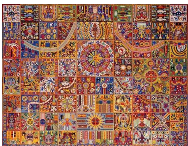
Mural Huichol - métro , station Palais Royal à Paris.

Le numéro 7 publié en novembre 2021 consacré à la diversité francophone