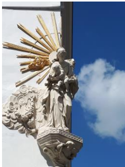
Statue de la Vierge Marie à Anvers (Belgique), avril 2019

Le numéro 4 publié en mars 2020 consacré à la solidarité interreligieuse