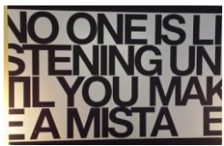
Affiche dans un café universitaire à Ljubljana (Slovénie), juillet 2018

Le numéro 2 publié en mars 2019 consacré à la diversité culturelle et religieuse