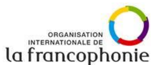
logo de l'organisation international de la Francophonie (OIF).

Le numéro 8 publié en mars 2022 consacré à la diversité des apprentissages et dédié à l'Ukraine