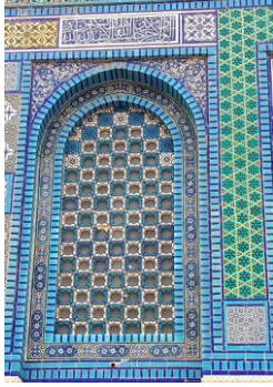
Mosquée al-Aqsa, Mont du Temple, Jérusalem (Israël) , janvier 2020

Le numéro 4 publié en mars 2020 consacré à la solidarité interreligieuse